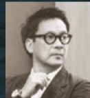
スティーブ・リオン

1957年に香港で生まれたスティーブ・リオンは、国際的にも認知されている、建築家、インテリアデザイナー、プロダクトデザイナーの一人です。現代的なスタイルを主張しているスティーブ・リオンの作品は、アジアの文化と芸術を巧みに取り入れ、洗練されたユニークなミニマリズムを反映しています。