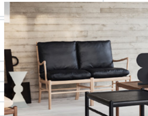
COLONIAL SOFA | OW149-2

エレガントなムク材のダイニングテーブル。サイズは90 x 90 cm、187 cmまで伸長することが可能です。伸長板は天板の両端にヒンジで固定され、来客時などに瞬時にセットすることが可能です。