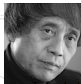
安藤 忠雄 1941-

1903年コペンハーゲンに生まれたオーレ・ヴァンシャーは、デザイナーとしてばかりか、デンマーク王立芸術アカデミー家具科の教授としてもデンマークデザイン界に大きな功績を残しています。今日オーレ・ヴァンシャーの家具は北欧モダンのクラシックとして世界中に知られています。