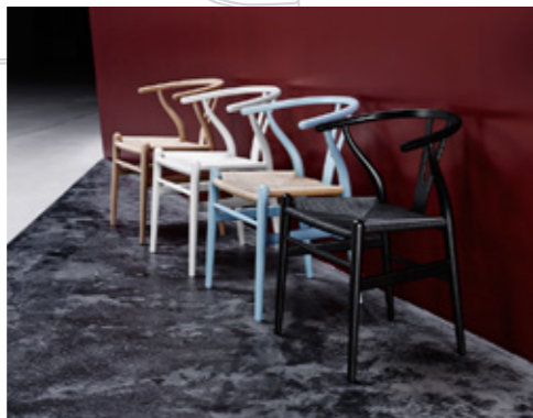
CH24 | Yチェア

Yチェアは古典的ともいえる、美しい彫刻的なフォルムをもつダイニングチェア。ゆったりとした背もたれを持つことから、くつろぐためのイスとしても最適です。